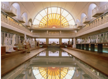
La piscine Art déco est devenue le musée d'Art et d'industrie André Diligent.

Traversant des banlieues souvent agréables, le tram ou le métro conduisent à Roubaix-Tourcoing, Villeneuve d'Ascq et à