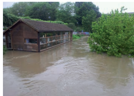
Le bâtiment de l'Office de tourisme à Orsay au matin du mercredi 1 er juin.

Même avant cela, dès la veille, nous avons vu tous ces agents de la Municipalité, de la Communauté de communes, de la Compagnie des eaux, ... qui étaient avec et parmi nous pour nous aider à faire face à la crue et à ses conséquences : ceux qui nous ont prévenus de l'inondation imminente, ceux qui ont proposé leurs bras pour mettre à l'abri de l'eau les objets qui pouvaient l'être, ceux qui ont sillonné nos rues pour évacuer et sauver les plus démunis d'entre nous, ceux qui ont hébergé et pris en charge, ceux qui nous ont appelés et qui se sont inquiétés de notre situation personnelle, ceux qui nous ont aidés à pomper les