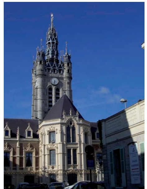
Le beffroi de Douai classé par l'UNESCO

Villeneuve d'Ascq, née en 1970 de la fusion de trois villages, présente un urbanisme contrasté : quartiers futuristes alternant avec des fermes flamandes et places de village. La nature y est très présente, en particulier avec le parc du Héron, le plus vaste espace vert de la métropole. On retrouve cette diversité dans les lieux culturels : musée des Moulins, musée du Terroir, mais aussi Lille Métropole musée d'art moderne, d'art contemporain et d'art brut, le LaM, un des musées français les plus riches en art contemporain. À partir du 25 juin, deux expositions sont proposées : - Jules Pascin, ou le dessin incisif ; - Dubuffet. Jean des villes, Jean des champs.