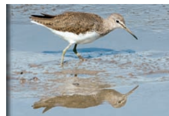
Le chevalier cul blanc