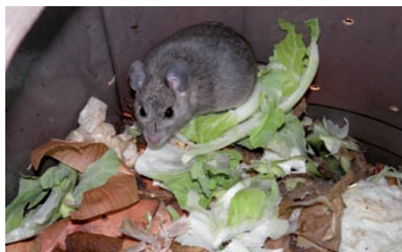
Un rat à l'œuvre dans une poubelle

Tout n'est donc pas aussi simple que ces syndicats veulent bien le dire : il n'y a donc pas que des avantages à composter