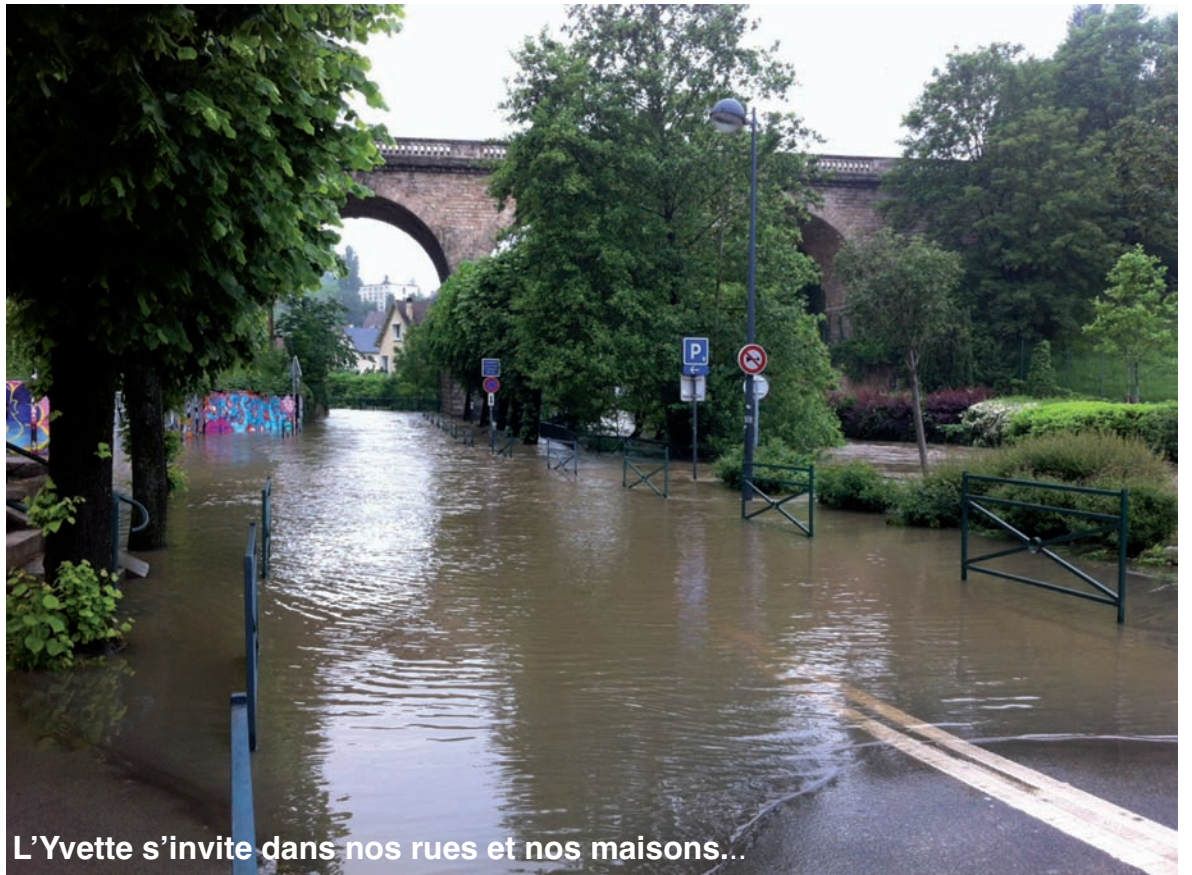
L'Yvette s'invite dans nos rues et nos maisons...