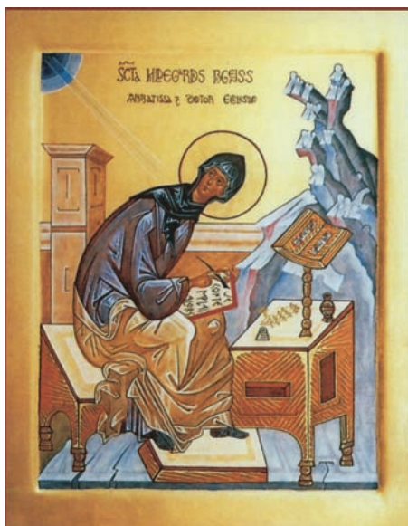
Icône de sainte Hildegarde de Bingen peinte par Marie-Cécile Froment

Le premier livre qui relate les visions d'Hildegarde de Bingen, illustré par 35 miniatures, est le Scivias (en latin, connais les voies ) consacré au salut de l'homme. Ce livre est tout à fait bien perçu par la grande figure spirituelle de l'époque, Bernard de Clairvaux, ainsi que par le pape Eugène III au synode de Trèves. Le deuxième livre est le livre des mérites de la vie qui décrit les vices mais aussi les vertus de l'homme, 35 en tout dont amour, humilité et paix, qui doivent l'élever vers Dieu. Le troisième est le livre des œuvres divines , où l'Esprit tient le cosmos, où la Terre est ronde, où l'homme